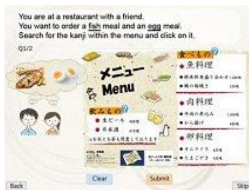
Hoạt động đọc menu có sử dụng các chữ Hán đã học