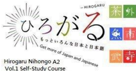
Khóa học "Hirogaru Nihongo A2 (Vol.1)

Khóa học "Hirogaru Nihongo A2 (Vol.2) (Khai giảng tháng 6 năm 2020)