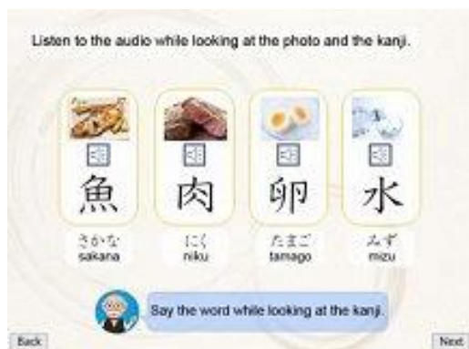
Học về ý nghĩa, cách đọc, hình dạng chữ Hán