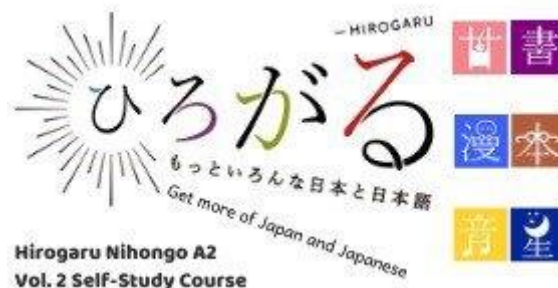
Khóa học "Hirogaru Nihongo A2 (Vol.2)

Đây là khóa học mà người học sử dụng trang web " Hirogaru - mở rộng kiến thức Nhật Bản và tiếng Nhật hơn nữa " để vừa nghe, đọc các câu chuyện về 12 chủ đề trong Vol.1 và Vol.2 vừa học thêm được các từ vựng mới.