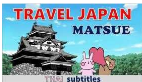
Khóa học bằng tiếng Thái

Khóa học "TRAVEL JAPAN WISH A HAPPINESS @ MATSUE A1-A2" (Khai giảng tháng 4 năm 2020)