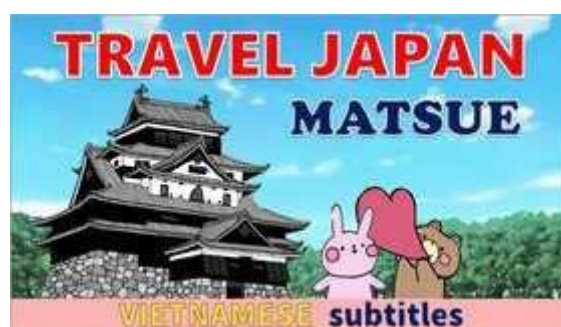
Khóa học bằng tiếng Việt

Đây là khóa học mà người học vừa học tiếng Nhật du lịch, vừa tham quan thành phố Matsue tỉnh Shimane nổi tiếng với chủ đề "cầu duyên".