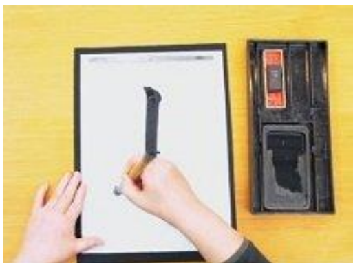
Video về cách cầm bút lông